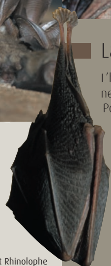
> Petit Rhinolophe

Pour cela, elles recherchent des gîtes frais à température et humidité constantes, tels les grottes, les constructions souterraines, les arbres creux... Leur température corporelle s'abaisse considérablement et leurs rythmes cardiaque et respiratoire ralentissent. Elles sont alors très fragiles et tout dérangement peut leur être fatal en raison de la dépense d'énergie nécessaire au réveil.