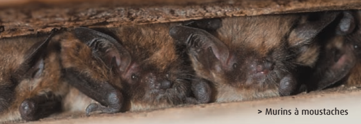
> Murins à moustaches