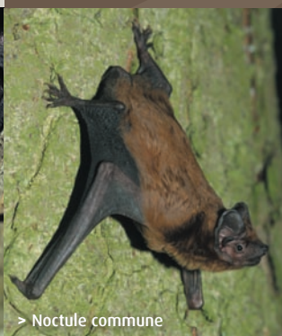
> Noctule commune