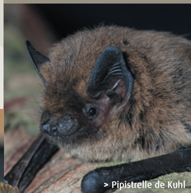
> Pipistrelle de Kuhl