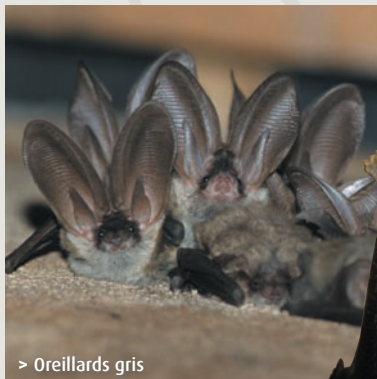
> Oreillards gris

"voir avec leurs oreilles" : ils chassent et s'orientent dans l'obscurité en utilisant les échos de leurs cris ultrasonores.