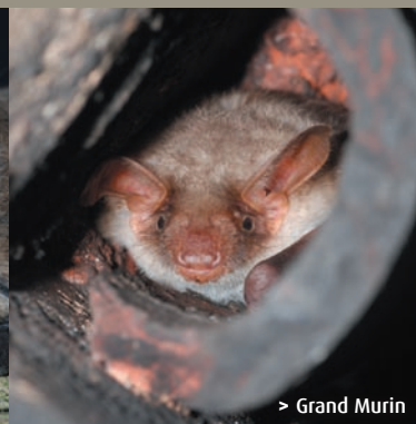
> Grand Murin