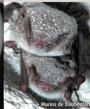
> Murins de Daubenton