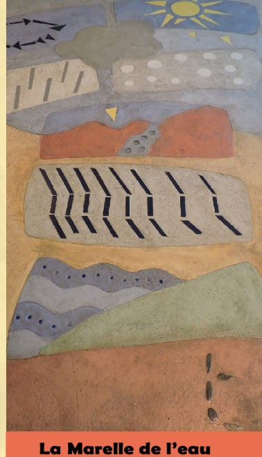
La Marelle de l'eau