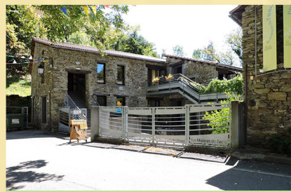
La Maison de l'Eau