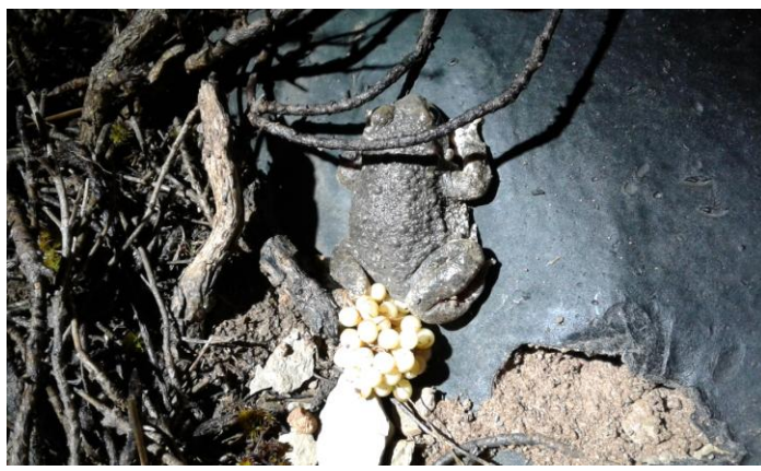
Ponde de pélodyte ponctué, 26/03/2018, Le Lagens