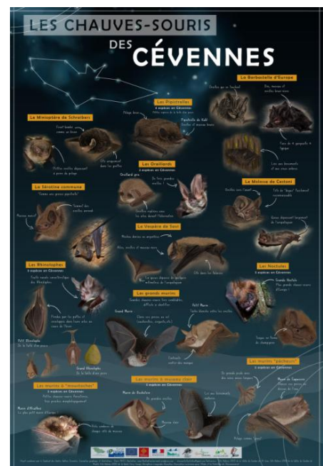
Aperçu du recto du poster

Le "Bon à Tirer" a également été transmis nous donnant la possibilité de réimprimer le poster.