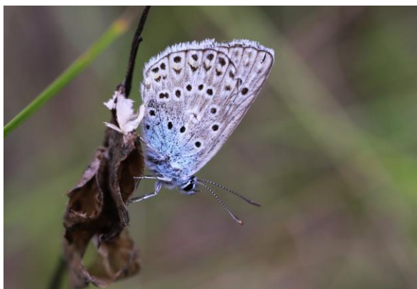
Polyommatus escheri , L'Azuré de l'Adragant 21/07/2018, Lanuéjols