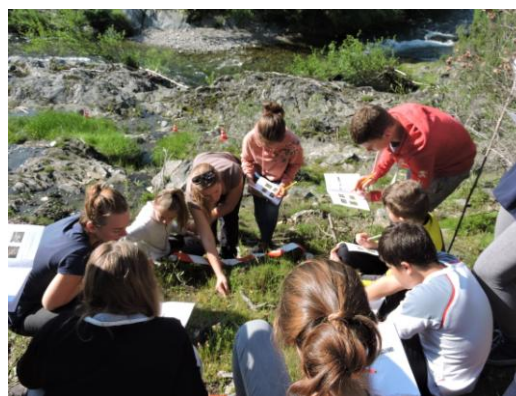
Rallye Nature 2018

-L'animatrice Natura 2000 a suivi la prestation de l'ALEPE (phase 1) pour la réalisation des animations scolaires dans la classe des Plantiers dans le cadre du projet d'exposition Natura 2000 en Lozère (cf action dans II.3.a).