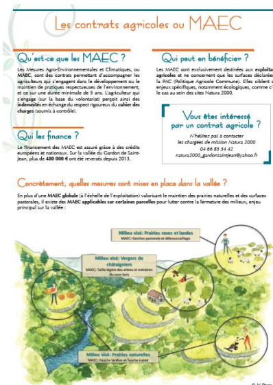
Aperçu de la 6 ème lettre d'information parue en novembre 2018