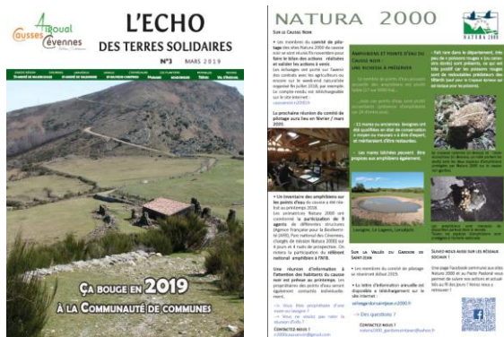
Article Natura 2000 sur le bulletin d'information de la CC CAC-TS

- Un article a été rédigé pour le bulletin d'information de la CC CAC-TS, L'Echo des terres solidaires, paru en mars 2019.