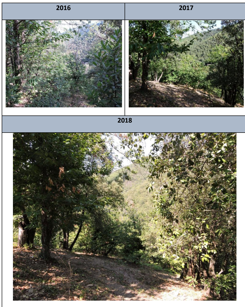
Evolution, 2 ans après les travaux, de la châtaigneraie contractualisée sur la commune de Peyrolles

Concernant le contrat déposé en 2016 « Restauration des châtaigneraies cévenoles méditerranéennes » à Peyrolles, un suivi photo d'évolution de la végétation a été réalisé. Le suivi administratif et technique des actions et des demandes de paiement a été réalisé, en lien avec le porteur de projet.