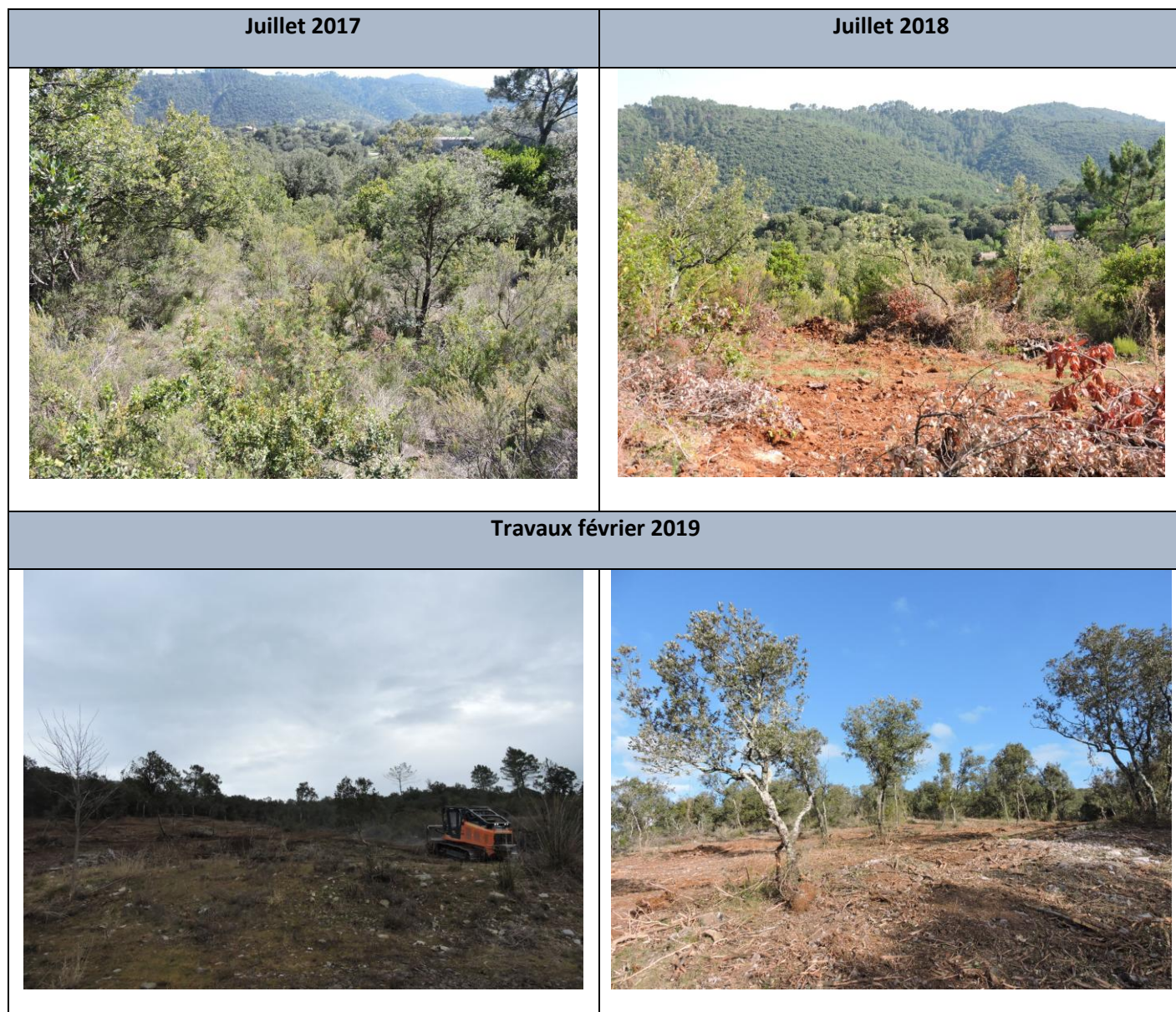
Suivi photo des travaux de bûcheronnage en haut puis photos des travaux de broyage en bas

Concernant le contrat déposé en 2017 « Restauration de milieux ouverts d'intérêt communautaire » à Corbès, un suivi photo a été réalisé lié aux travaux de bûcheronnage. Suite à des problèmes liés au bûcheronnage, il a fallu remettre à plat tout le contrat et réécrire le cahier des charges, en lien avec la DDTM du Gard et le porteur de projet. Les travaux ont pu se faire en février 2019.