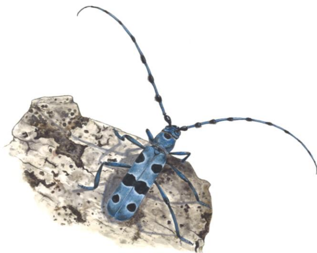
Rosalie des Alpes, Rosalia alpina

Une première réunion technique s'est tenue le 16 octobre 2017 à l'Estréchure avec les partenaires potentiels du projet (sites Natura 2000 voisins, OPIE, PNC, ONF, CRPF et Syndicat des propriétaires forestiers du Gard). Une seconde réunion, incluant les services de l'Etat (DDT et DREAL), a eu lieu le 9 février 2018. Concernant le site « Vallée du Gardon de St-Jean », la première phase du projet a démarré en 2018 avec un partenariat avec l'OPIE et le PNC sur un évènement le 29 juillet 2018 ayant pour thématique « La biodiversité forestière » à la Maison forestière d'Aire de côte (voir II.3.b. Organisations de réunions d'information ou de manifestations). L'organisation et la coordination de cet évènement ont été pilotées par l'une des animatrices Natura 2000, qui a également assuré des animations le 29 juillet.