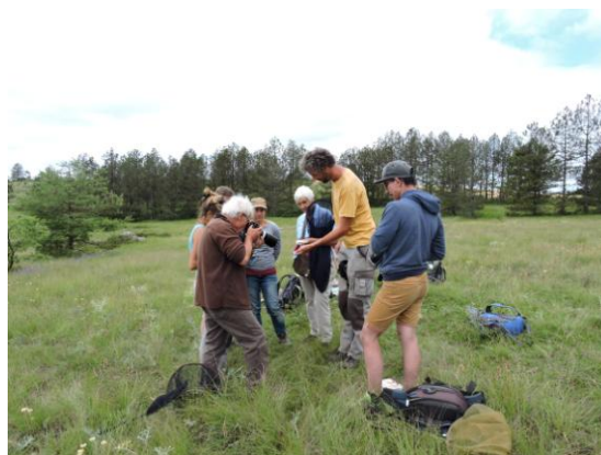
Initiation aux papillons de jour avec Gard Nature, 21/07/2018

Sur les 4 demi-journées d'animation proposées sur le week-end, il y a eu 12, 14, 16 et 14 participants, ainsi que 11 pour les animations nocturnes.