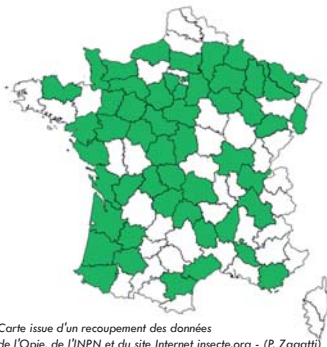
Carte issue d'un recoupement des données de l'Opie, de l'INPN et du site Internet insecte.org - (P. Zagatti)