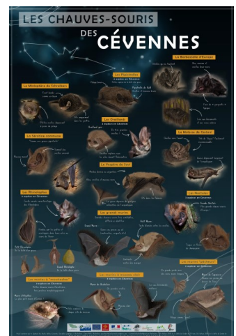
Aperçu du recto du poster

Une réédition et réimpression de ce poster ont été réalisées par le Syndicat des Hautes vallées cévenoles, coordinateur de ce projet. Plusieurs exemplaires nous ont été transmis, nous permettant la diffusion de ce document dans le site.