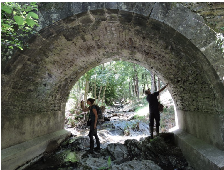
Prospection par le CEN d'une voûte favorable aux chiroptères

En addition à l'accompagnement du CD30 concernant la thématique chiroptère et réfection des ponts, un travail a été réalisé par la DDTM du Gard pour que cette problématique ne soit plus portée en totalité par les chargé.es de mission Natura 2000. Le CD30 a démarché ses partenaires pour répondre à ce besoin. Le Conservatoire d'Espaces Naturel (CEN) d'Occitanie a donc réalisé sur la période des prospections sur les futurs travaux prévus pour 2021. L'animatrice a accompagné les agents du CEN dans leur prospection.