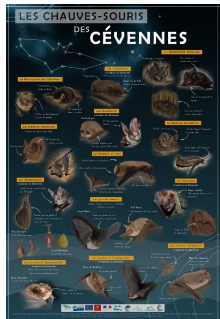
Aperçu du recto du poster