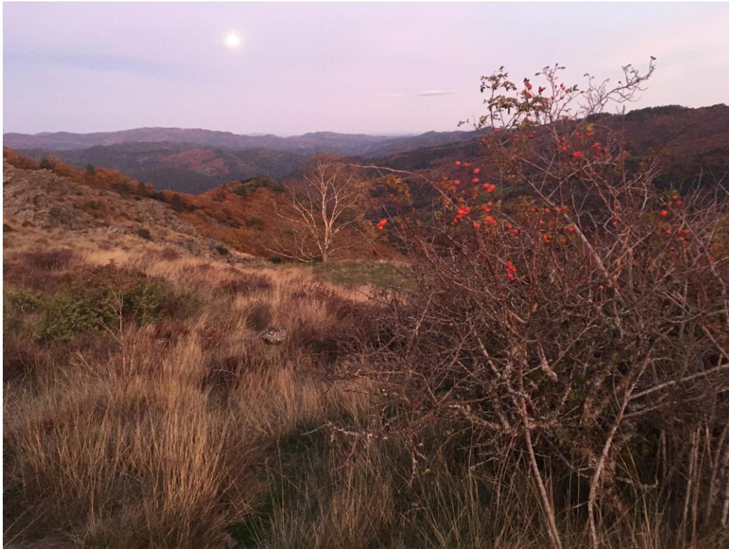
Zone de prospection de la laineuse du prunellier (Le Pompidou)

le 10/09/2020) ainsi que la prospection d'un lépidoptère : la laineuse du prunellier (sorties terrain le 15 et 29 octobre 2020). Les animatrices ont aussi participé à une réunion, le 09/02/2021 avec leur homologue du CPIE des causses méridionaux dans l'optique de créer une synergie d'actions sur les sites du Causse Noir gardois.