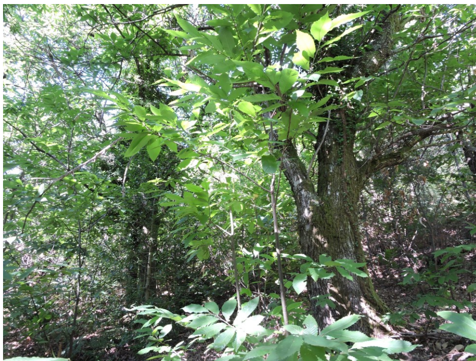
Châtaigneraie présente sur la propriété forestière

En parallèle, de nouveaux projets ont émergés suite aux échanges avec des habitants. Notamment concernant un projet sur une propriété forestière, ainsi que la réfection d'une tour pouvant accueillir des petits rhinolophes. Ces projets seront étudiés en 2021 dans l'optique de monter un contrat Natura 2000.