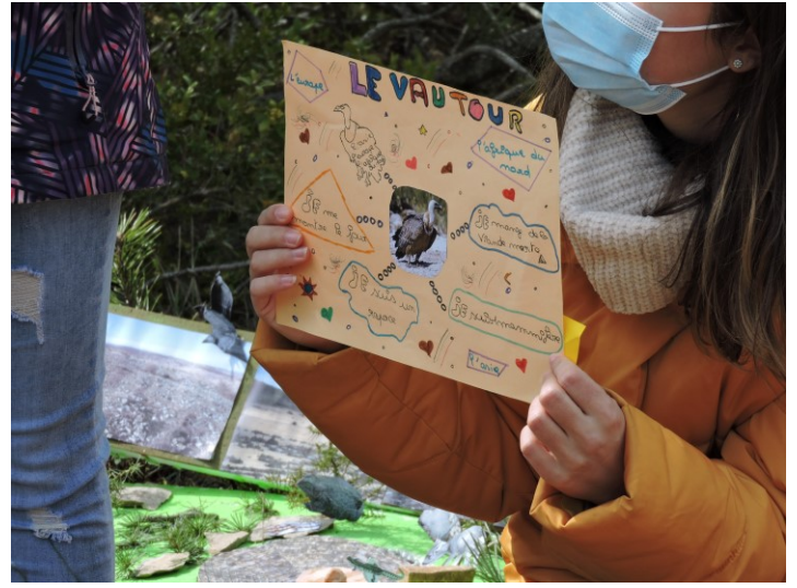
Inauguration de la Lavogne avec les élèves de Lanuéjols et de Trèves : à gauche – découverte de la chasse aux trésors ; à droite – panneau de présentation, réalisé par les enfants, d'un groupe d'espèces pouvant utiliser la Lavogne