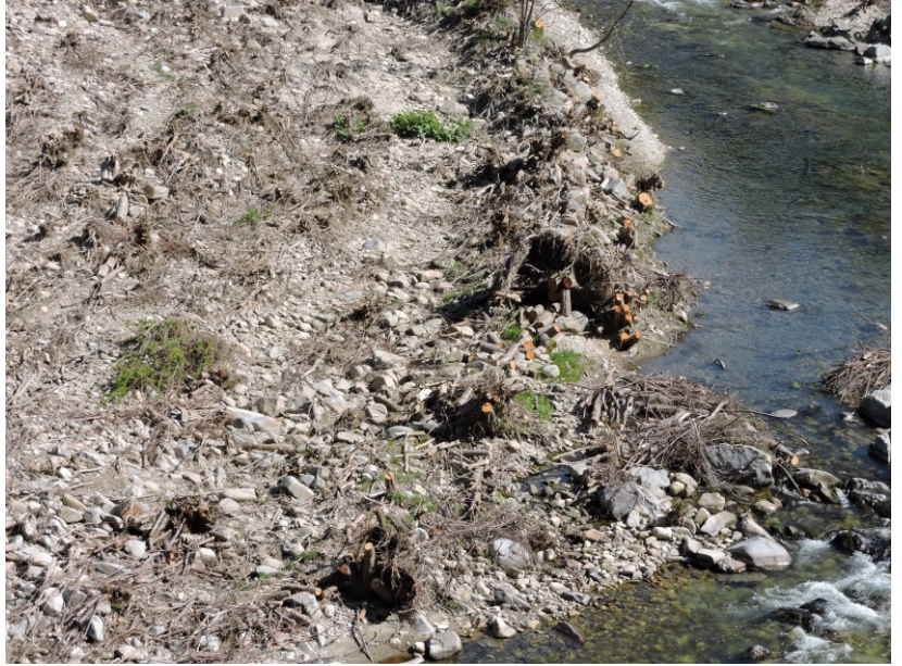
Travaux post-crue sur le gardon de Saint-Jean