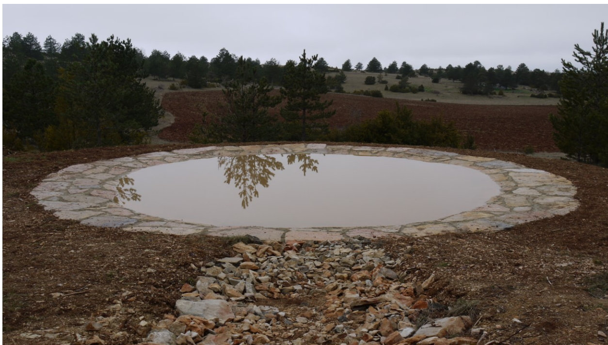
La lavogne contractualisée finalisée

Enfin, l'animatrice a débuté l'accompagnement du porteur de projet pour le dépôt du dossier de demande de paiement qui sera déposé lors de la prochaine période de subvention.