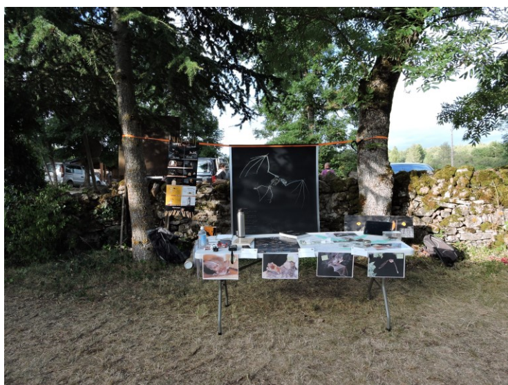
Stand « A la découverte des chauves-souris » durant la Nuit du Causse Noir

Suite à la réduction d'effectifs sur la période, les animations prévues dans le cadre de la Nuit du Causse Noir et de la fête de Trèves ont été réalisées via des prestations. L'animatrice a accompagné les prestataires pour que la commande corresponde à celle définie par le COPIL. L'animatrice a assisté aux deux animations.