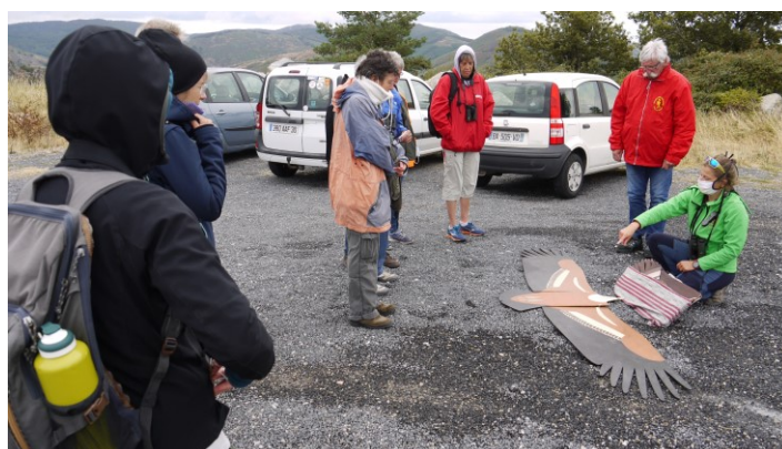
Balade "A la découverte des oiseaux"

Les animatrices peuvent être sollicitées par des élus pour participer aux conseils municipaux et présenter les actions Natura 2000. Pour cette période, elles n'ont pas été sollicitées.