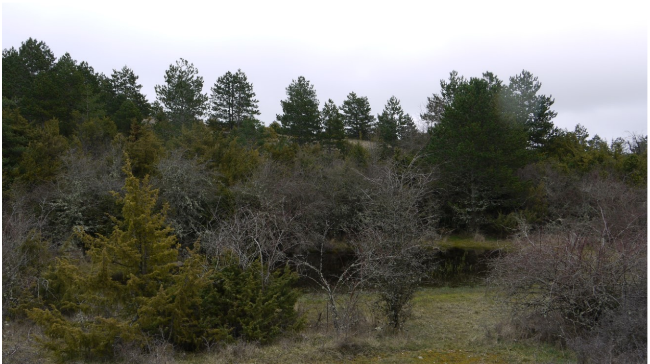
Point d'eau "Sot de rebillière" : mare végétalisée inventoriée dans le cadre du suivi mis en place en 2017

amandé par des enquêtes sur l'usage de ces points d'eau par les propriétaires. En raison de la crise sanitaire, une grande partie des enquêtes ont dû être reportées. Nous espérons pouvoir finaliser cette action en 2021 ou 2022.