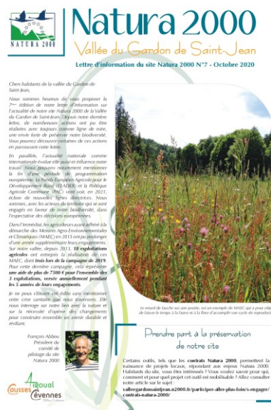
Aperçu de la 7 ème lettre d'information parue en octobre 2020

En 2020, une lettre d'information a été rédigée et distribuée à l'ensemble des habitants de la vallée.