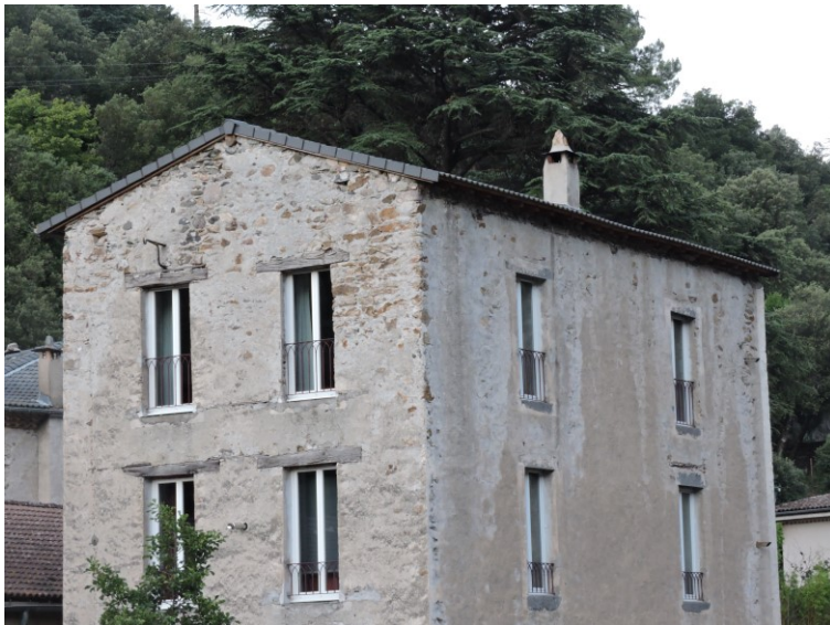
Point de vue du suivi de sortie de gîte de la colonie de pipistrelles

Concernant le deuxième cas, l'expertise a pu être finalisée en 2020. Il a été conclu que la colonie posant des problèmes de cohabitation est une colonie de pipistrelle. Il n'a pas pu être formellement identifié s'il s'agissait des pipistrelles communes ou pygmées. Ces espèces ne faisant partie des espèces d'intérêt communautaire, l'accompagnement aux aménagements n'a pas été réalisé.