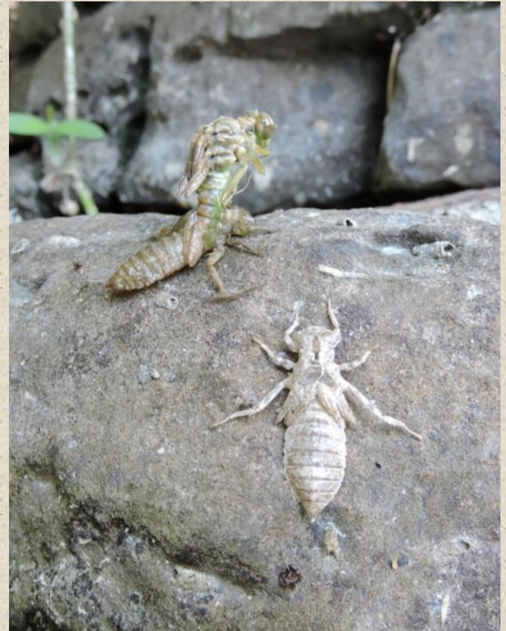
Emergence d'une libellule et exuvie