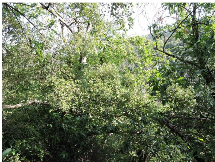
Châtaigneraie avant contrat (28/08/2016)