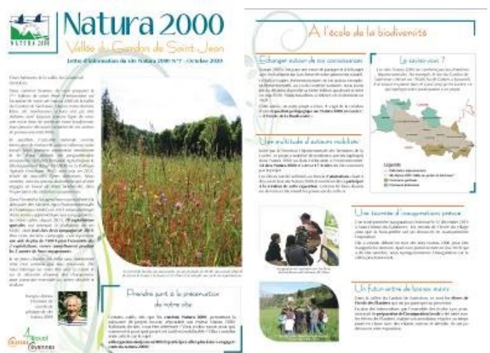
Aperçu de la 7ème lettre d'information parue en octobre 2020

La lettre d'information est aussi diffusée informatiquement et téléchargeable sur le site internet.