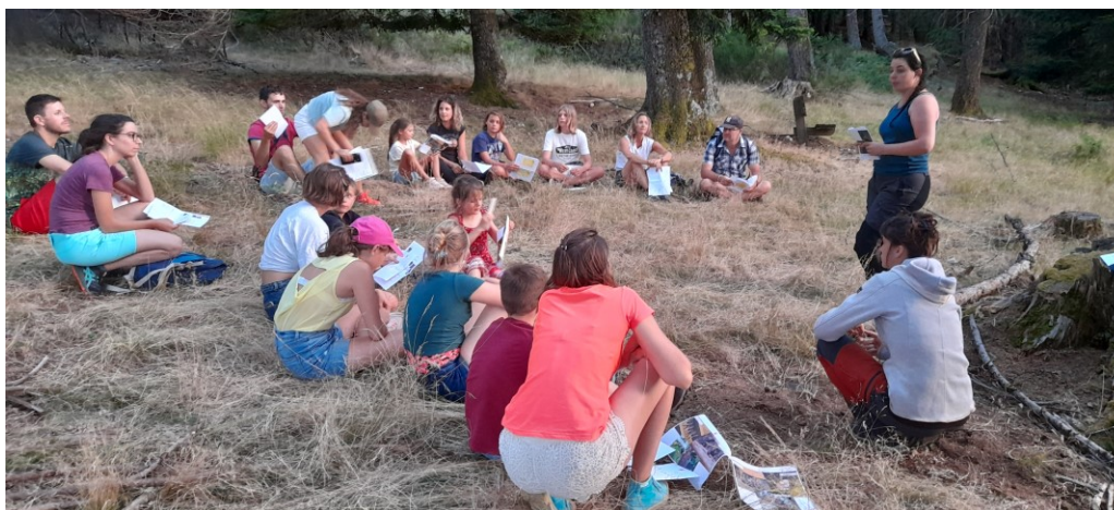
Atelier acoustique chiroptère

Animation « Le bois mort plein de vie » : coorganisé avec l'agent de la maison de l'eau (CC CAC-TS), l'objectif est de sensibiliser le grand public à la richesse de la biodiversité dans nos vieilles forêts et plus particulièrement autour du bois mort ou dépourissant. L'animation s'est focalisée sur deux taxons d'importances pour le site Natura 2000 : les insectes et les chiroptères. L'animatrice a coanimé cette animation sur la période.