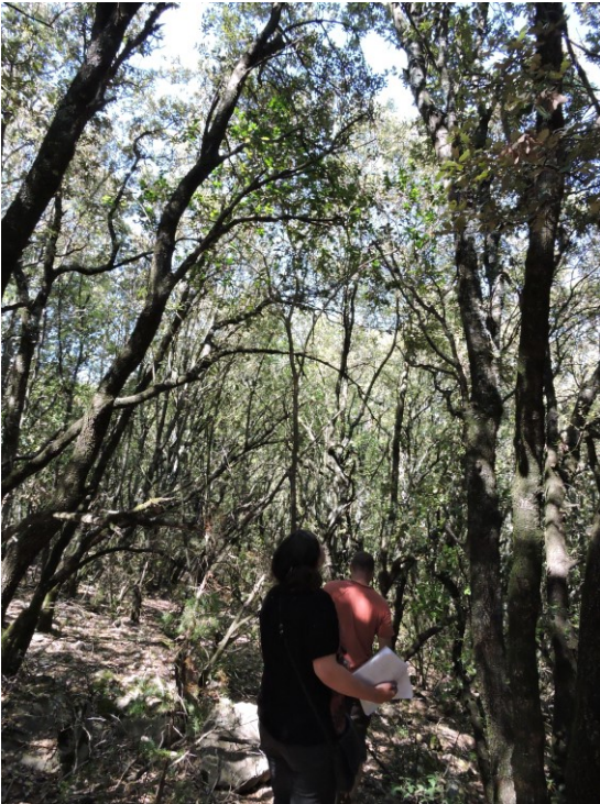
Potentielle parcelle contractualisable pour une restauration de milieux ouverts d'intérêt communautaire

CC CAC-TS auprès du porteur de projet sur la bonne tenue des objectifs du contrat au regard des projets de ce dernier.