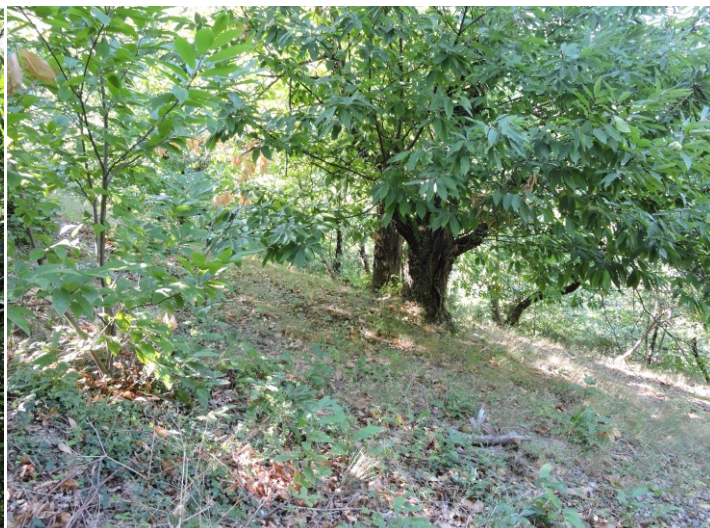
Châtaigneraie à N+5 du contrat (24/09/2022)

Concernant le contrat déposé en 2017 « Restauration de milieux ouverts d'intérêt communautaire » à Corbès, suite à sa sollicitation, un accompagnement a été réalisé par le service Natura 2000 de la