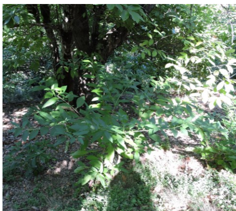
Matte de Raisins d'Amérique avant traitement