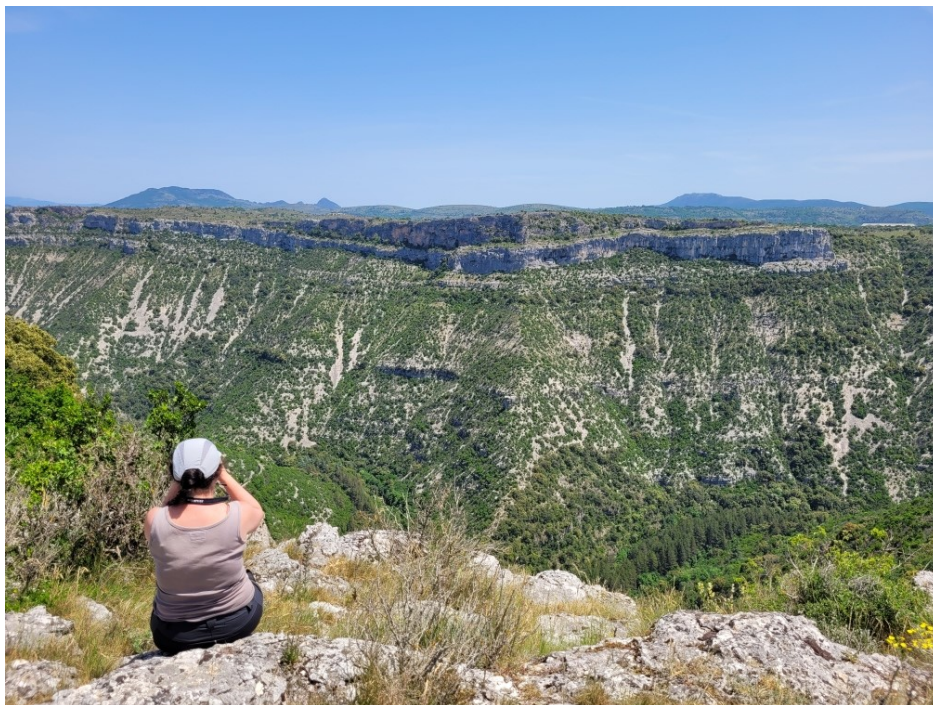
Suivi des comportements de reproduction du Crave à Bec rouge

Une animatrice a notamment participé à un suivi de comportements de reproduction sur un site Natura 2000 animé par la communauté de communes du Pays Viganais. Le but était d'acquérir des compétences de suivi de l'espèce. En 2023, des échanges avec le CEN Occitanie permettront de déterminer les besoins en actions sur le site du Causse Noir qui n'ont pas été identifiés sur la période 2022.