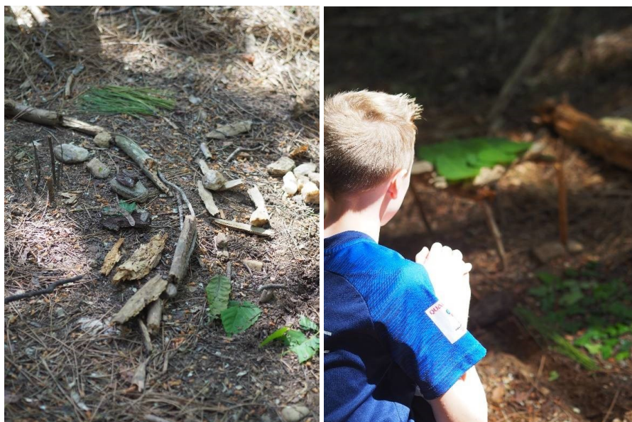
Atelier « mon paysage de demain » - Rallye Nature 2022

Pour répondre aux exigences sanitaires liées à la COVID19 la 7 ème édition a dû être adaptée. Les élèves des deux collèges participants n'ont pas pu être rassemblés. L'action s'est