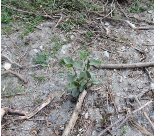
Plant de renouée du Japon