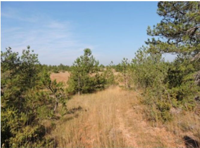
Zone du contrat avant réalisation des travaux (2019)

Une réunion de suivi a été effectuée sur la période. Cette réunion permet d'identifier les besoins d'entretien ainsi que de suivre l'évolution du projet.