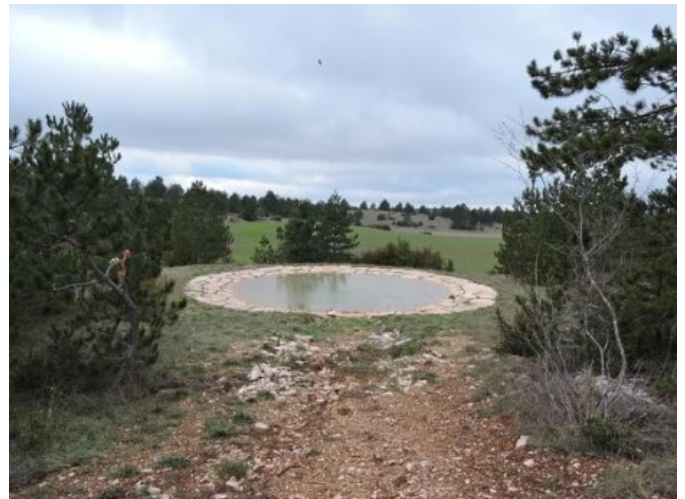
Lavogne contractualisée (décembre 2022)