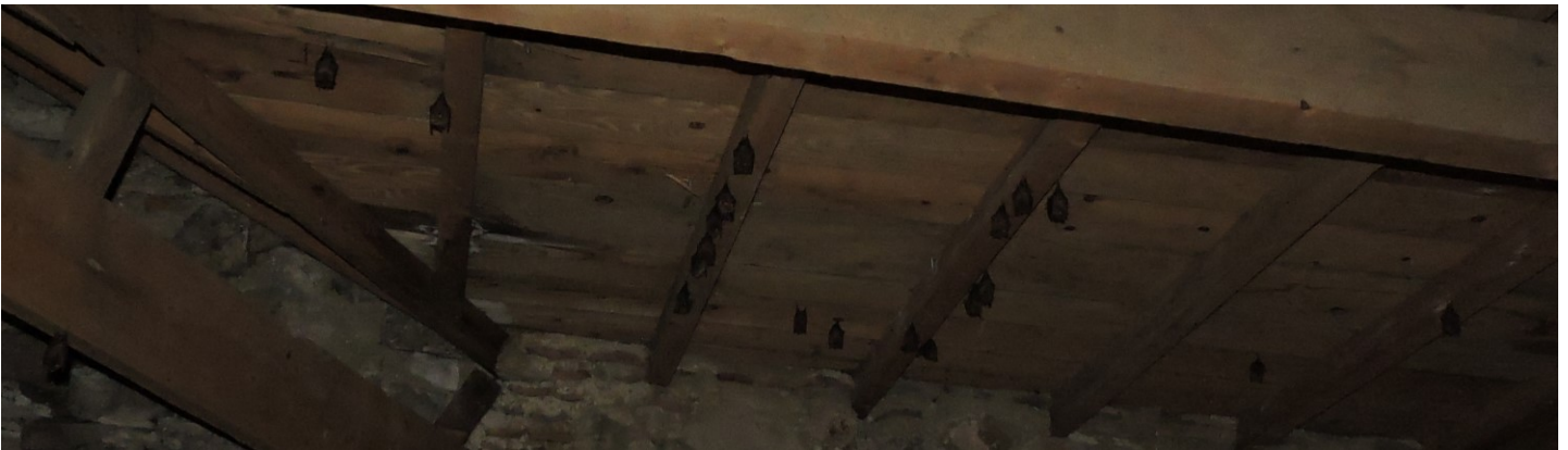
Colonie de reproduction de Petits Rhinolophes suivi par le service Natura 2000 de la CC CAC-TS