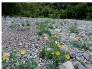
Bancs de graviers à Glaucière jaune