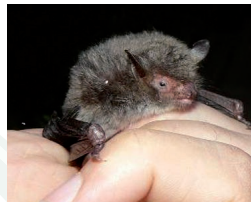
Murin de Capaccini

« Si vous rencontrez ces espèces ou observez ces milieux, à vos notes... »